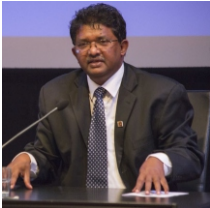
ජ්‍යෙෂ්ඨ මහාචාර්ය අනුර මනතුංග